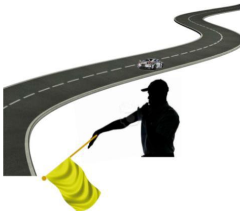
INMOVILIZADO A LA DERECHA