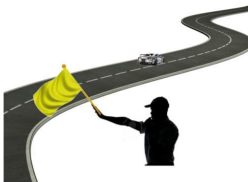
INMOVILIZADO A LA IZQUERDA