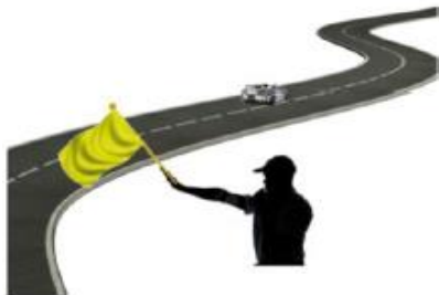
INMOVILIZADO A LA IZQUERDA