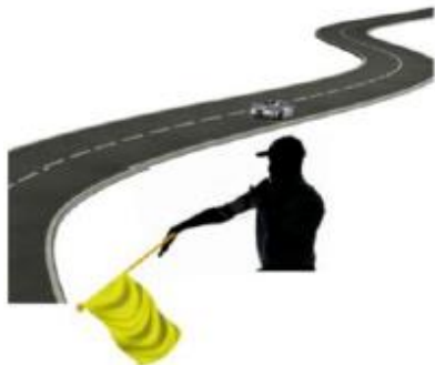
INMOVILIZADO A LA DERECHA