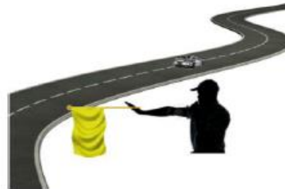
INMOVILIZADO EN EL CENTRO